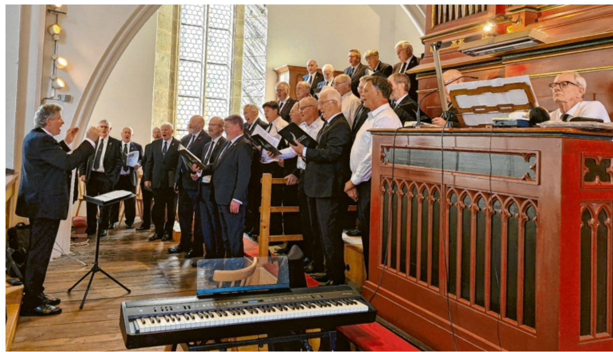
Ein Männerchor aus Neuseeland hat zusammen mit der Chorgemeinschaft und zwei Solisten ein Konzert in St. Georg gegeben.

Den Auftakt in St. Georg machte die Chorgemeinschaft durch ihren Sängergruß „So G'sell so“. Mit einem abwechslungsreichen Män-