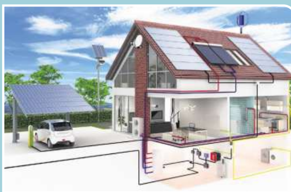
Eine professionelle Planung der privaten PV-Anlage ist wichtig.