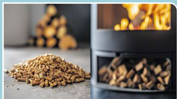
Pellet- oder Holzöfen als sinnvolle Ergänzung zur Wärmepumpe.

Hybride Heizsysteme liegen im Trend, z. B. die Kombination von Kachelöfen mit Wärmepumpen und anderen regenerativen Technologien. Moderne Kachelöfen, Heizkamine, Kaminöfen und Pelletöfen heizen dank fortschrittlicher Verbrennungstechnik effizient, schadstoffarm und helfen, den fossilen Energieverbrauch zu reduzieren – für eine klimaschonende Wärmeversorgung im Sinne der Energiewende.