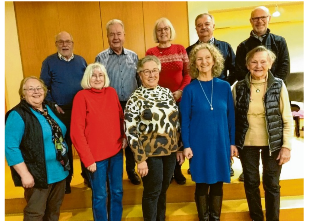
Die Vorstandschaft des Wertinger Liederkranzes.