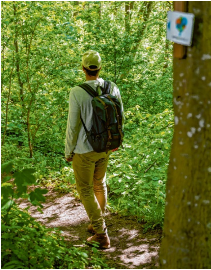
Es darf wieder gewandert werden.

Deutschlands flachster Premiumwanderweg beendet die Winterpause